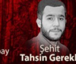
Şehit Tahsin Gerekli